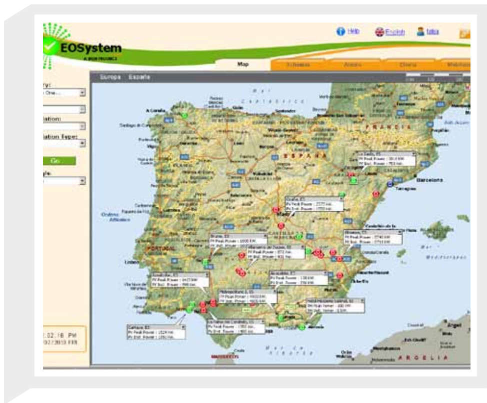
Sistema GIS (Geographic Information System) para navegación por las distintas instalaciones